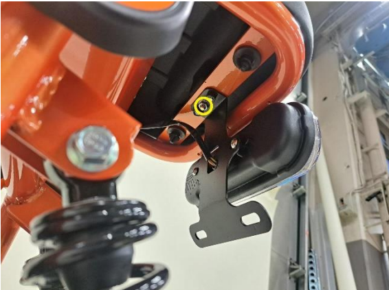
Irrota istuimen kiinnitysmutteri (kiintoavain 10 mm).