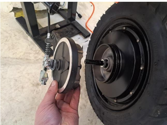
Irrota takajarru takapyörästä.