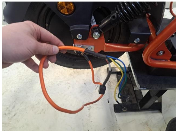
Vedä moottorin johto vapaaksi.