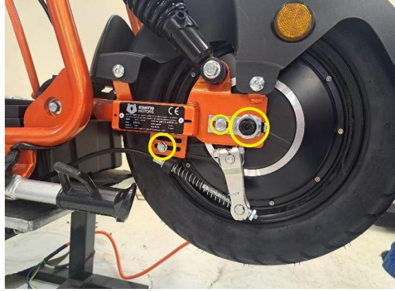
Irrota takajarrun kiinnikkeen kiinnityspultti ja moottorin lukituslevyn lukituspultti (kiintoavain 10 mm). Löysää taka-akselin lukitusmutteri (kiintoavain 24 mm).