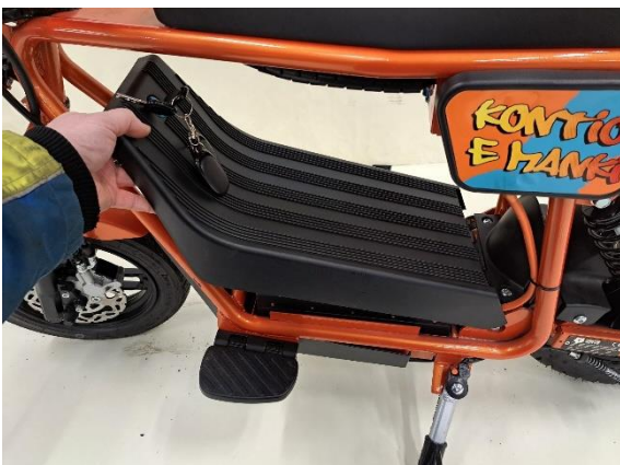
Ota akkukotelon kansi pois.