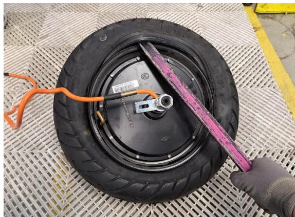
Irrota rengas moottorista. (rengasrauta).

Uuden osan asennus käänteisessä järjestyksessä.