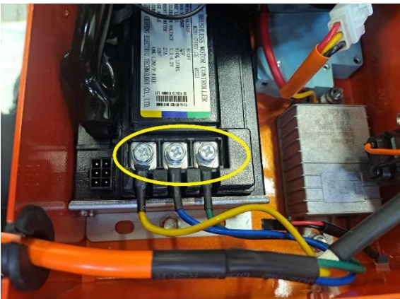
Irrota moottorin vaihejohtimien kiinnityspultit ohjain laitteesta (ristipäämeisseli ph2 tai kiintoavain 8 mm).