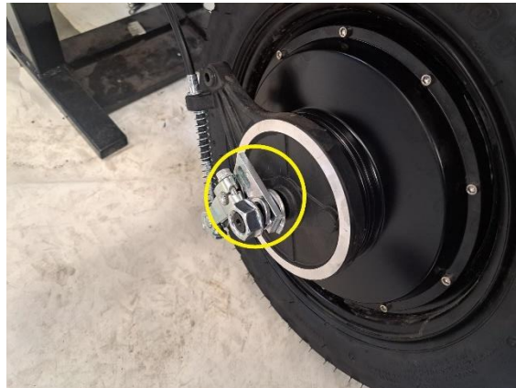
Irrota takajarrun puoleisen taka-akselin mutteri, jousiprikka ja moottorin lukituslevy.