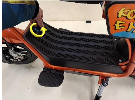
Avaa akkukotelon kannen lukitus.