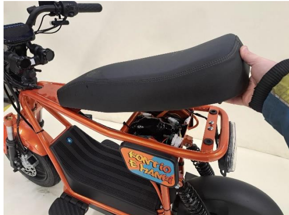
Ota istuin pois.