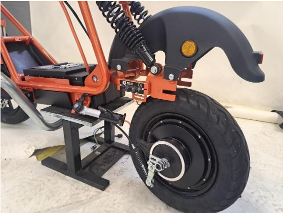
Laske takapyörä alas.