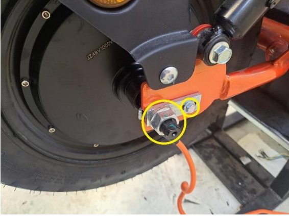
Irrota moottorin lukituslevyn lukituspultti (kiintoavain 10 mm). Löysää taka-akselin lukitusmutteri (kiintoavain 24 mm).