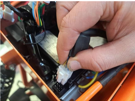
Irrota moottorin hall anturin liitin ohjainlaitteesta.